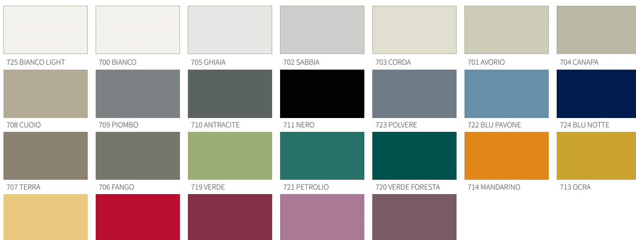
725 BIANCO LIGHT 700 BIANCO 705 GHIAIA 702 SABBIA 703 CORDA 701 AVORIO 704 CANAPA 708 CUOIO 709 PIOMBO 710 ANTRACITE 711 NERO 723 POLVERE 722 BLU PAVONE 724 BLU NOTTE 707 TERRA 706 FANGO 719 VERDE 721 PETROLIO 720 VERDE FORESTA 714 MANDARINO 713 OCRA 712 ORZO 715 ROSSO 716 BORDEAUX 717 LAVANDA 718 PRUGNA

COULEURS LAQUÉES MATES / MATT LACQUERED COLOURS / LACKFARBEN MATT